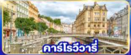
คาร์โรวัวร์