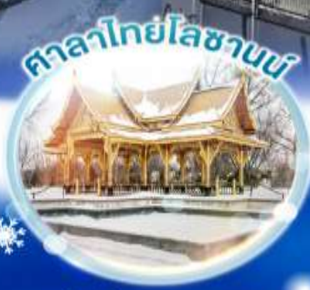
ศาลาไทยโลซานน์