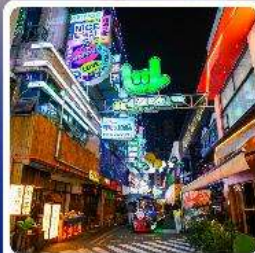
ถนนคนเดินซินหยุน