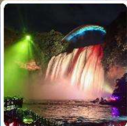
น้ำตกหวงกั๋วชู่