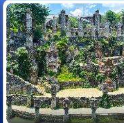
ปราสาทหินเย่หลางตู้