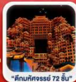
"ตึกมหัศจรรย์ 72 ชั้น"