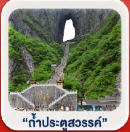
"กำแพงคู่สวรรค์"