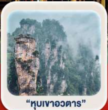
"ทิวเขาอวตาร"

พัก 4 ดาวทุกคืน !! ไม่ลงร้านรัฐบาล ไม่จ่ายออฟชั่นหน้างาน