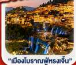
"เมืองโบราณฟู่หลงเจิ้น"