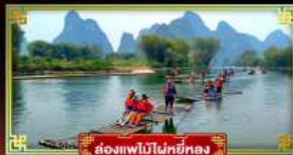
ล่องแพไม้ไผ่หยี่หลง