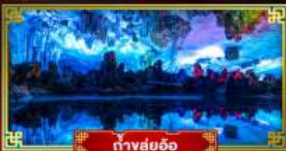
ถ้ำสุ่ยอ้อ

"ดินแดนแห่งสายน้ำและขุนเขา" สัมผัสประสบการณ์นั่งบอลลูนชมวิวมุมสูง