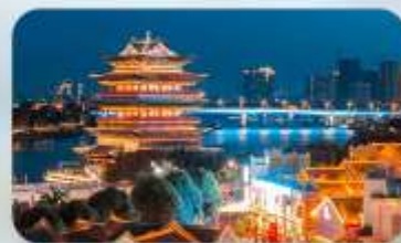
ถนนสามสายสองตรอก