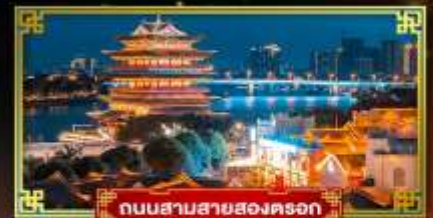
ถนนสามสายสองตรอก