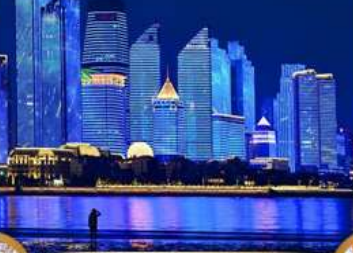
หาดโซเบอร์ฟังก์