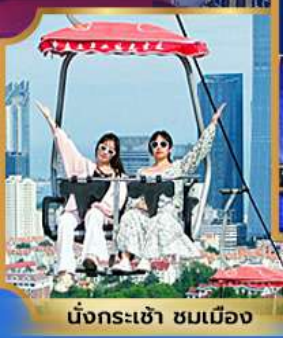
นั่งกระเช้า ชมเมือง