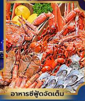
อาหารซีฟู้ดจัดเต็ม

บุฟเฟ่ต์เบียร์ไม่อื่น + ซีฟู้ด + ปิ้งย่างเกาหลี