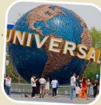
5 UNIVERSAL BEIJING