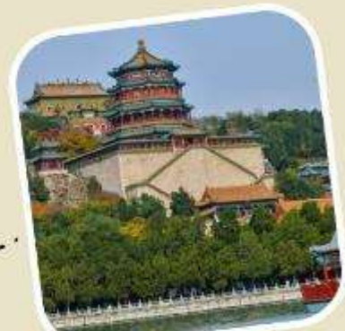
4 พระราชวังฤดูร้อน