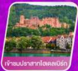
เจ้าชบปราสาทไฮคสเบิร์ก

โรงแรม 4 ดาว อาหาร 14 มื้อ โทคน้ำ 14 เที่ยว น้ำหนัก 23 กก.