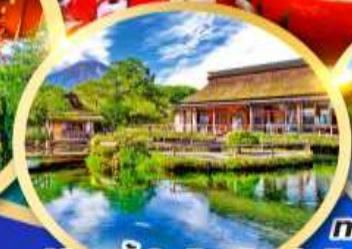
หมู่บ้านน้ำใสโอชิโนะฮักโกะ