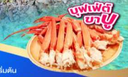
บุฟเฟ่ต์ ขาปู