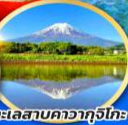
ทะเลสาบคาวากูจิโกะ