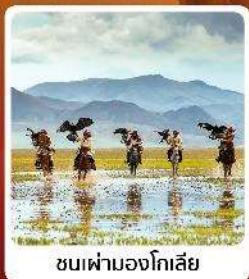
ชมเฟ้ามองโกเลีย