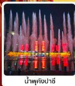
น้ำพุคังปาซี

● โอโล่ เป็นทราseyเสียงชาวมองโกลแห่งท้องถิ่นระดับ 5A ของจีน ภูเขาไฟอูลันฮาตา น้ำพุคังปาซี น้ำพุที่สูงที่สุดในเอเชีย