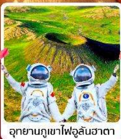
อุทยานภูเขาไฟอูลันฮาตา