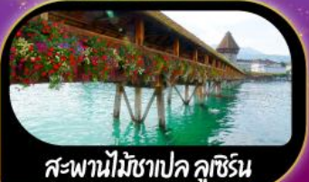
สะพานไม้ชาเปล คุชิเรน