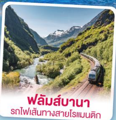
พลัมส์บานา รถไฟเส้นทางสายโรเมนติก