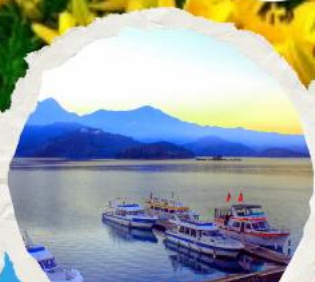
ทะเลสาบสุริยขึ้นจินชางรา