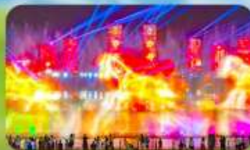
น้ำพุคนตรีคังปาสือ