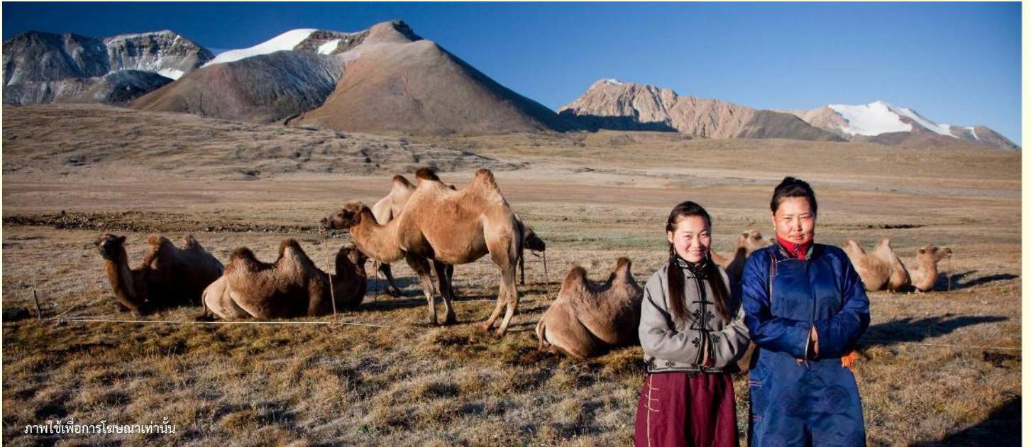
ภาพใช้เพื่อการโฆษณาเท่านั้น

นำท่านร่วมกิจกรรม พิธีต้อนรับแขกสไตล์มองโกล เป็นประเพณีโบราณที่มีมาช้านาน ชาวมองโกลมีอุปนิสัยที่รักเพื่อนฝูงและตรงไปตรงมาไม่เสแสร้ง เมื่อมีเพื่อนหรือแขกมาเยือนก็มักจะผูกมิตรอย่างจริงจัง และนำท่านร่วมกิจกรรม สวมใส่ชุดมองโกล สัมผัสพลังแห่งบรรพบุรุษ สวมเสื้อคลุมแบบดั้งเดิมที่มีสีสันสดใส ปักลวดลายอันประณีต คุณจะสัมผัสได้ถึงพลังแห่งบรรพบุรุษที่เคยปกครองดินแดนครึ่งโลก การสวมหมวกขนสัตว์ ผูกสายรัดเอว พร้อมเครื่องประดับเงินแท้ที่ส่องแสงระยิบระยับ จะทำให้ท่านเสมือนกลายเป็นนักรบแห่งทุ่งหญ้า พร้อมเครื่องประดับเงินแท้ที่ส่องแสงระยิบระยับ ของชนเผ่าที่เคยปกครองดินแดนครึ่งโลก เมื่อคุณยืนท่ามกลางทุ่งหญ้าไร้ขอบเขต