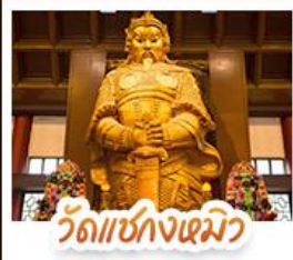
วัดเชกวงเมว