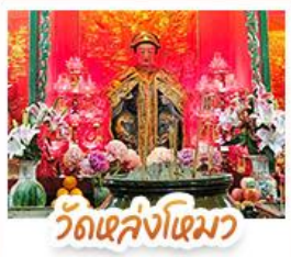
วัดเล่งโงเมว

นึ่งรรางพืดแตรมสู่ TOP OF PEAK • ซ้อบบึงจู่โจมกิก และ CITYGATE OUTLAETS • นึ่งกระช้านองบึง สีกการะพระใหญ่เทียนกาน • จอพรเจ้าแม่หล่งโหมว แม่ง่อง 5 มิงกร ให้ประะสบความสำเร้งในทุกๆ ด้า