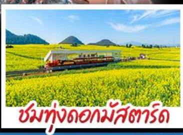
ชมทุ่งดอกมัสตาร์ด