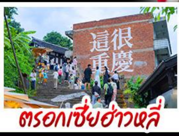
ตรอกซี้ยฮ่าวหลี่