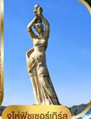
จูไห่ฟิชเชอร์เก็สรา