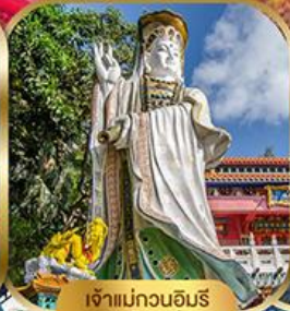
เจ้าแม่กวนอิมรีพลัสเบย์