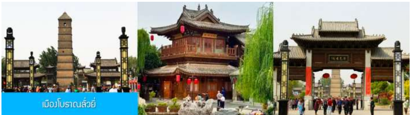
เมืองโบราณฉั่วหยี่

16.18 น. ขบวนรถไฟนำคณะเดินทางถึงสถานีรถไฟนครฉั่วหยาง นำคณะขึ้นรถบัสเพื่อเดินทางสู่นครฉั่วหยาง