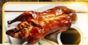
เปิด Four Season