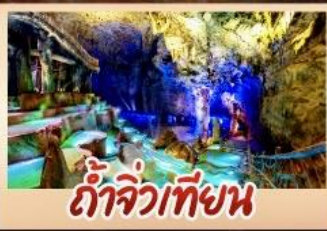
ถ้ำจิวเทียน