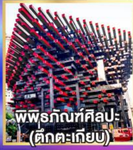
พิพิธภัณฑ์ศิลปะ: (ตึกตะเกียบ)