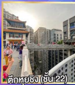
ตึกหุยซิง (ชั้น 22)