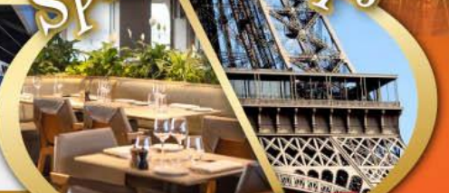
รับประทานอาหารกลางวัน บนห่อไอเฟล

ไฮไลท์ในโปรแกรม • สะพานไมซ์าเปล ลูเซิร์น