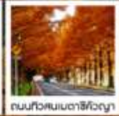
ถนนทิวสนเมตาชิคังญา