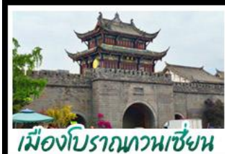
เมืองโบราณทวนช่ียน

ภูเขาสิ่ตรุนี - อุทยานบ่ิฝิ่งโกว - สะพานหนานเฉียว - ร้านหนังสือจงซูเก้อ - เมืองโบราณกวนเสียน จตุรัสหย่างเทียนหู่ - หนีพ่นต้าซลฟี - ถนนโบราณชอยกว้างชอยแคบ - ถนนคนเดินไท่โก่วหลี่ ถนนคนเดินซุนซี - ถนนโบราณจั้นหี่ - พ่นต้าฮักเปิ่นตัก - บ้านไฟไม้ไฟตักSKP - วัดต้าฉือ