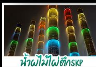
น้ำไฟไม้ไฟตักSKP