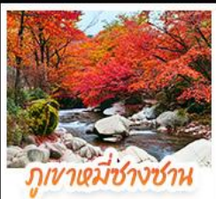
ภูเขาหมี่ชางชาน