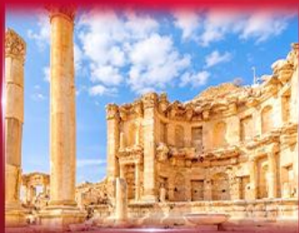
เมืองโบราณเพตรา