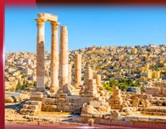
ป้อมปราการอันมาน