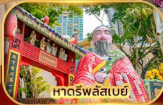
หาดรพลัสเบย์