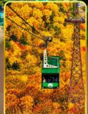
กระเช้าคุโรดากะ