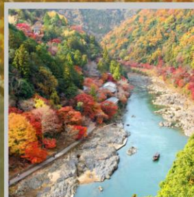
“ARASHIYAMA MT. KAMEYAMA”