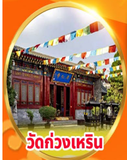
วัดกวงเหริน