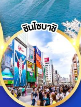
ชินโซมาชิ