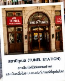
สถานีทูเนล (TUNEL STATION) สถานีรถไฟใต้ดินสายเก่าแก่ และเป็นหนึ่งในระบบขนส่งที่เก่าแก่ที่สุดในโลก