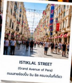
ISTIKLAL STREET (Grand Avenue of Pera) ถนนสายช้อปปิ้ง อิม บิล ครบจบในที่เดียว