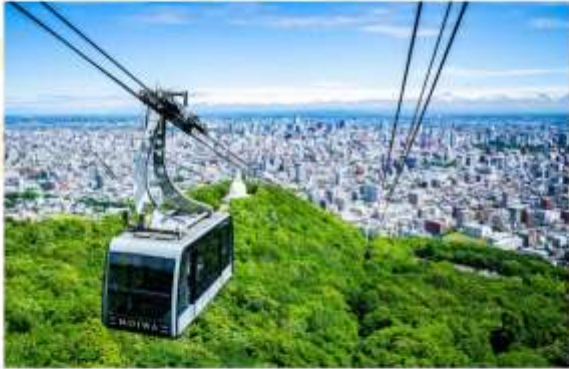
MT. MOIWA (CABLE CAR)