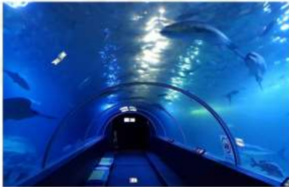
KUSHIMOTO MARINE PARK