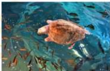
KUSHIMOTO MARINE PARK