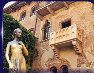
เขื่อนบ้านจูเลียต เวโรนา