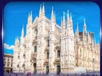
เซ็กวันวิหารดูโอโม มิลาโน