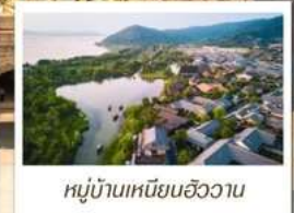
หมู่บ้านเหนียนฮิววาน

🗑️ โหลด 23 KG. x1 ทิ้งไป - กลับ ✓ พรีเมียมทัวร์ ✓ ไม่เข้าร้านรัฐบาล ✓ ทัวร์กรุ๊ปเล็ก ✓ รวมค่าเข้าชมสถานที่ตามโปรแกรม