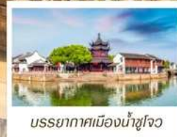
บรรยากาศเมืองน้ำซูโจว