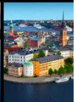
เที่ยว 4 เมืองหลวง แห่งสแกนดิเนเวีย