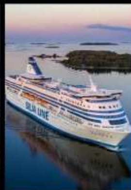
SILJA LINE OVERNIGHT CRUISE