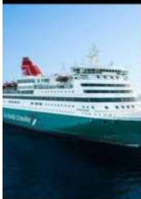
GO NORDIC OVERNIGHT CRUISE