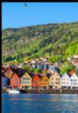
เมืองท่าแสนสวย เบอร์เก็น