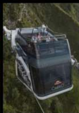
ยอดเขาสแตนเซอ์ฮอร์น