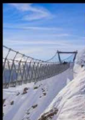
ยอดเขาทิสลิส