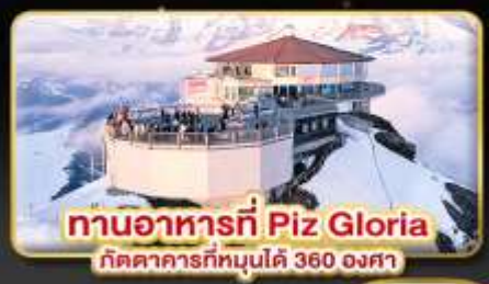
ทานอาหารที่ Piz Gloria กิตติาคารที่หมุนได้ 360 องศา