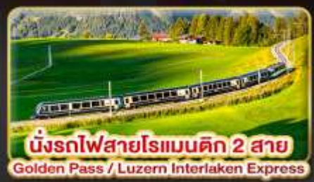
นั่งรถไฟสายโรเมนติก 2 สาย Golden Pass / Luzern Interlaken Express