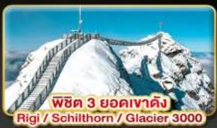
พีชิต 3 ยอดเขาดัง Rigi / Schilthorn / Glacier 3000