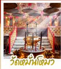
วัดเมื่อนไทมว