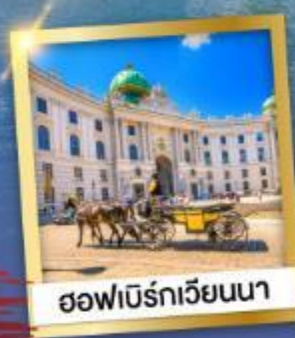
ชอเฟิร์กเวียนนา