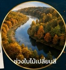
ช่วงใบไม้เปลี่ยนสี